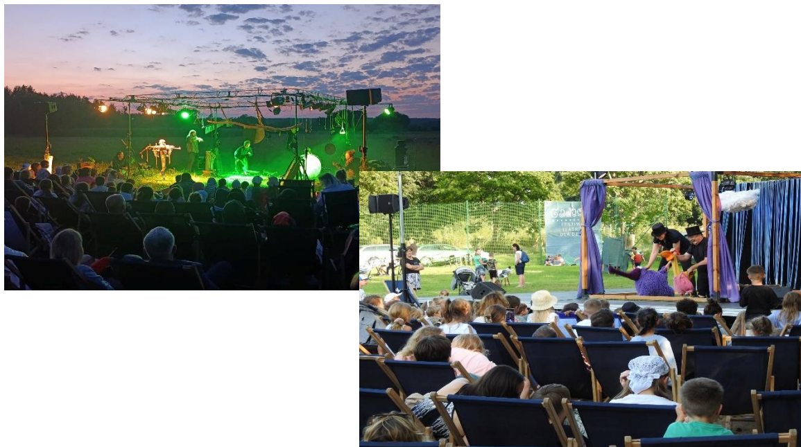
Nadbużański Festiwal Teatrów dla Dzieci GADUCHA