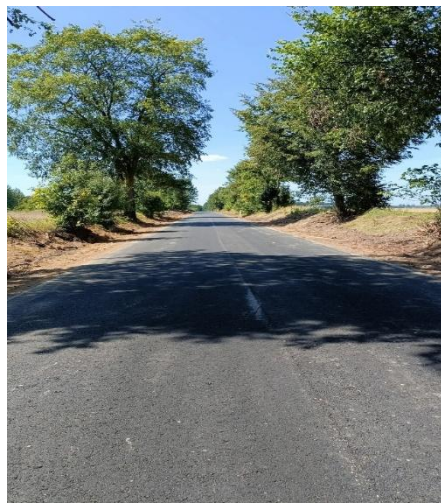
Droga powiatowa nr 2012W Chybów - Litewniki Stare - Walim - Nowa Kornica