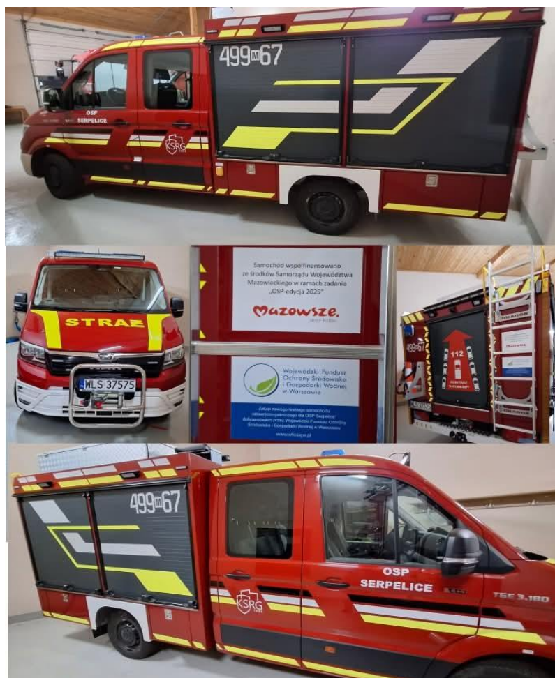
Samochód MAN TGE 4x4