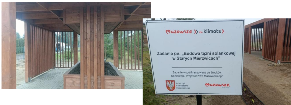
Tężnia solankowa w Starych Mierzwicach

Wartość projektu wyniosła 313 748,40 zł. Kwota dofinansowania 200 000,00 zł.