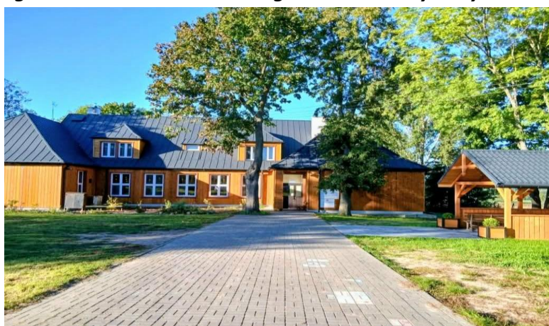
Budynek Dziennego Domu Senior+ w Nowych Hołowczycach

Wartość całkowita zadania wyniosła 395 501,75 zł, z czego 250 000,00 zł pochodziło ze środków Rządowego Funduszu Polski Ład: Program Odbudowy Zabytków.