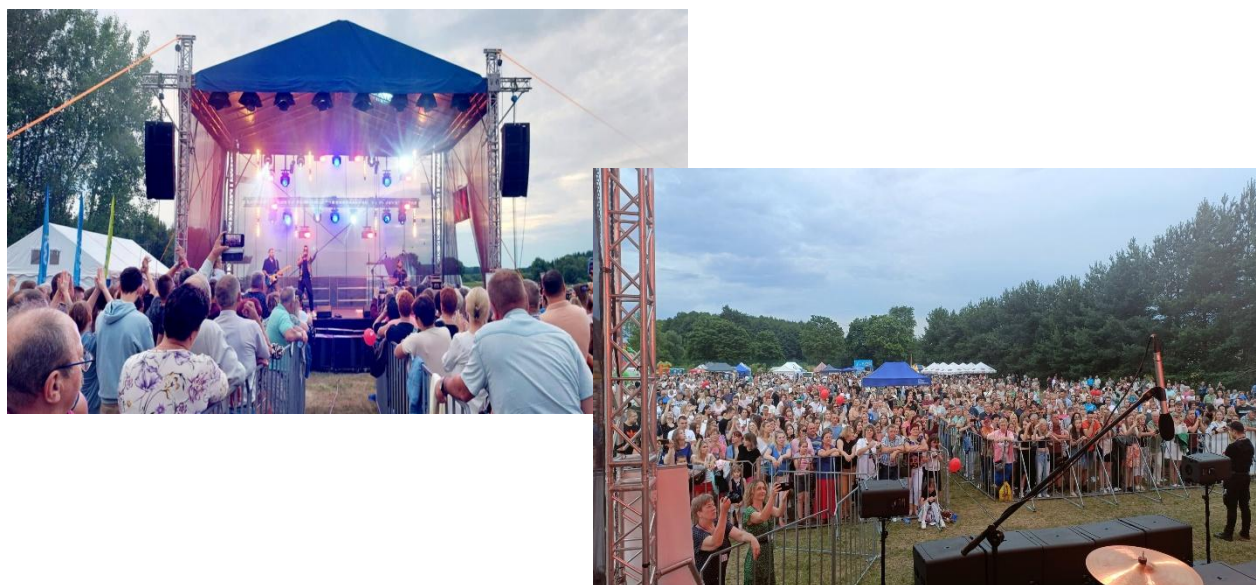
Festyn gminny „Gmina Sarnaki Się Bawi!”