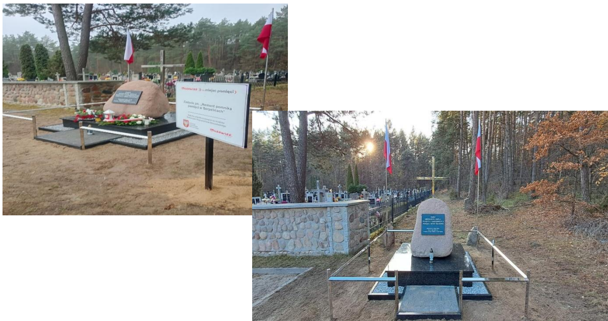
Pomnik pamięci w Serpelicach

Wartość projektu 47 500,00 zł, dofinansowanie 37 952,88 zł.