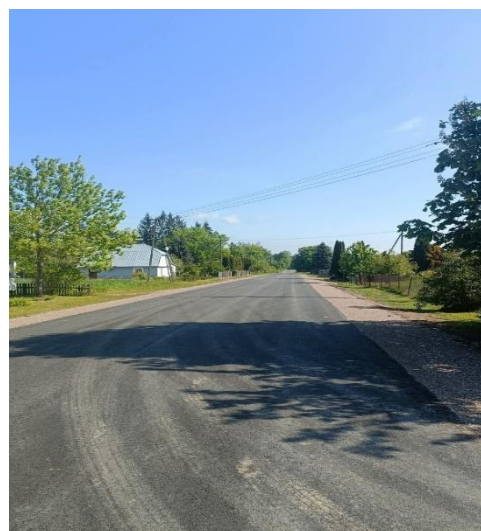
Droga gminna nr 200514W w miejscowości Nowe Litewniki