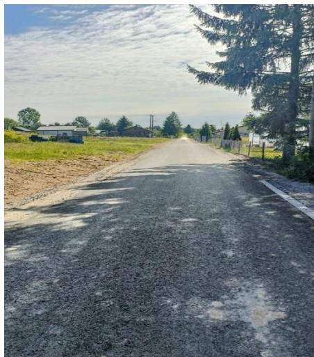
Droga gminna nr 200521W i droga wewnętrzna nr ewidencyjny 338 w miejscowości Chlebczyn