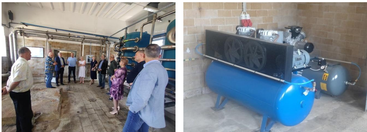
Stacja Uzdatniania Wody w Klepaczewie