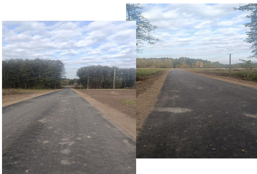
Droga gminna nr 200527W w miejscowości Hołowczyce - Kolonia

Zadanie zostało zrealizowane w ramach dotacji z Samorządu Województwa Mazowieckiego ze środków pochodzących z wyłączenia gruntów z produkcji rolnej w wysokości 173 154,17 zł. Wartość całkowita zadania wyniosła 437 388,00 zł.