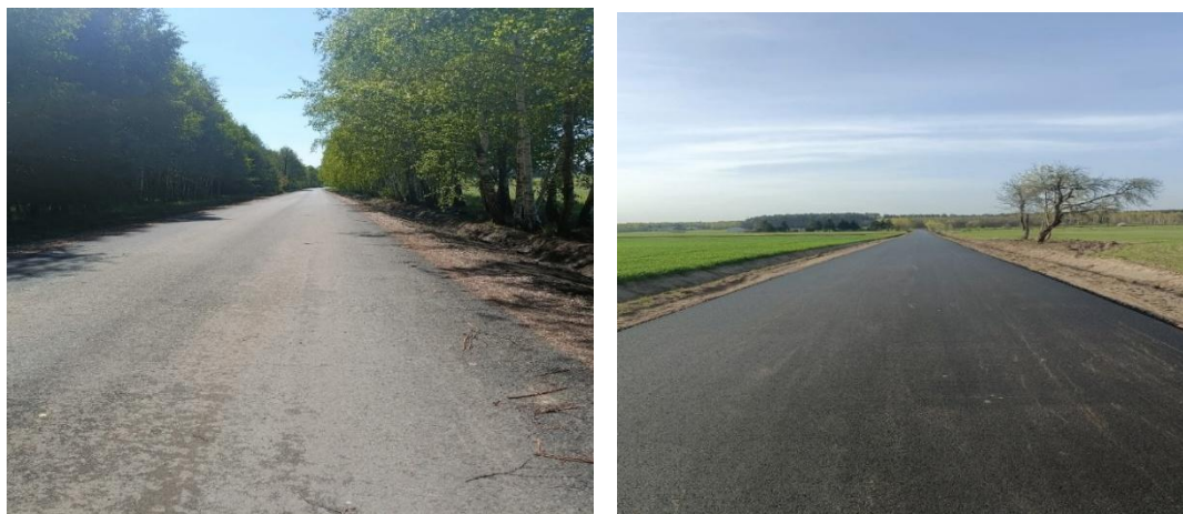
Droga gminna nr 200518W w miejscowości Rozwadów

Dzięki wykonaniu nawierzchni bitumicznej na tej drodze zmniejszą się bieżące koszty utrzymania drogi.