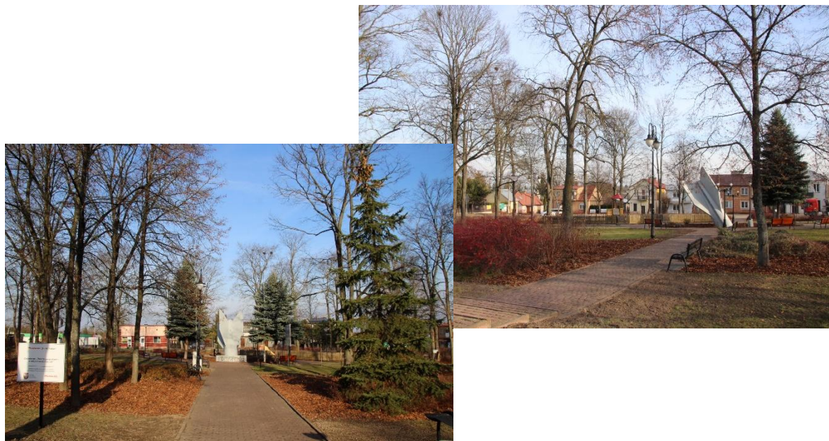
Park w miejscowości Sarnaki

W ramach projektu przeprowadzono pielęgnację drzew na skwerku.