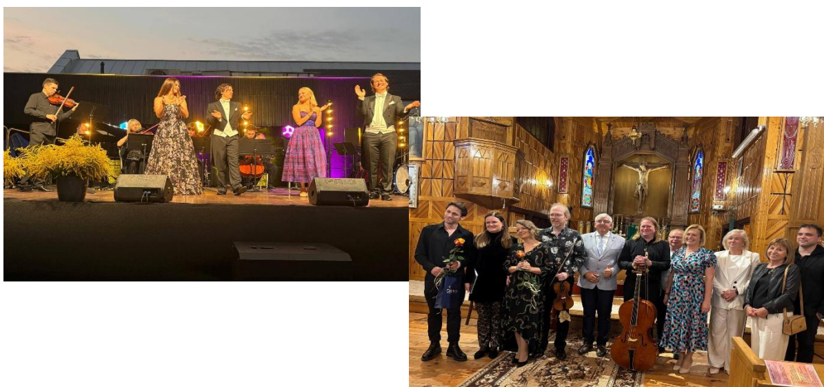
Klasyczne koncerty w Gminie Sarnaki - koncert plenerowy w Sarnakach i koncert w Serpelicach