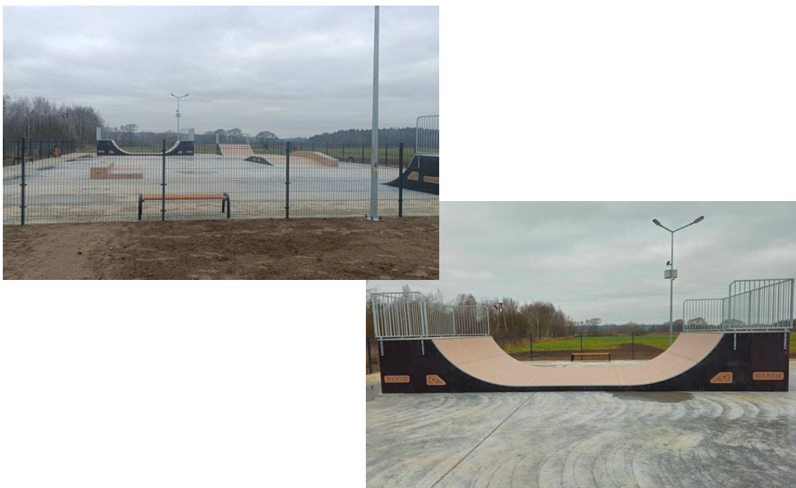
Skatepark w miejscowości Sarnaki

Powstanie skateparku to ważny krok w rozwoju infrastruktury sportowo-rekreacyjnej gminy. Nowe miejsce sprzyja aktywności fizycznej, integracji młodzieży oraz rozwijaniu sportowych pasji, stając się jednocześnie atrakcyjnym punktem na mapie Sarnak.