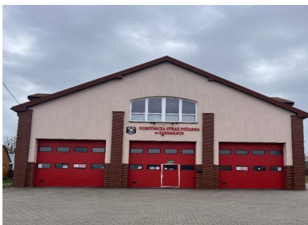
Bramy garażowe w budynku OSP Sarnaki

Wartość projektu wyniosła 40 467,00 zł, z czego aż 40 000,00 zł stanowiło dofinansowanie.