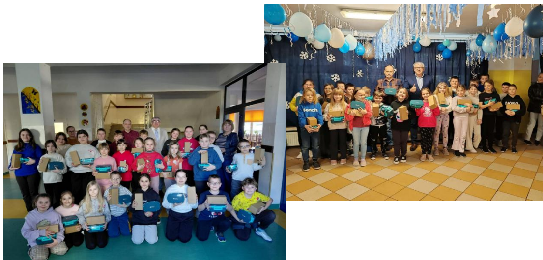
Uczniowie Szkoły Podstawowej w Sarnakach i Zespołu Szkolno - Przedszkolnego w Serpelicach biorący udział w projekcie

Całkowita wartość zadania wyniosła 32 200,00 zł, z czego dofinansowanie z Ministerstwa Sportu w ramach programu „Umiem pływać” 14 000,00 zł. Pozostałe środki, czyli 18 200,00 zł zostało pokryte w ramach środków własnych gminy z tzw. funduszu alkoholowego w ramach realizacji Gminnego Programu Profilaktyki Rozwiązywania Problemów Alkoholowych i Przeciwdziałania Narkomanii.